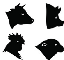
PLANTELES Y ESTABLOS DE CRIANZA Y ENGORDA