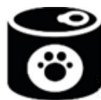
PLANTAS DE RENDERING