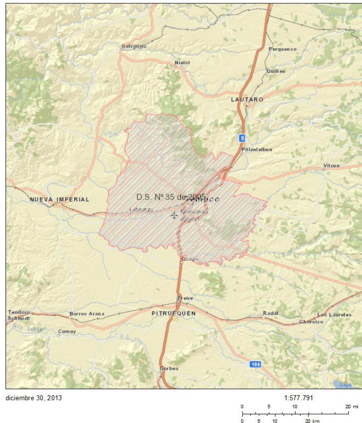
Figura 1. Zona Saturada por Material Particulado Respirable MP10, declarada mediante Decreto Supremo N° 35 de 2005 del MINSEGPRES. (fuente: Sistema de Información Territorial NEPAassist).

El día 2 de marzo de 2005, se declaró Zona Saturada por Material Particulado MP10 , como concentración de 24 horas, a las comunas de Temuco y Padre Las Casas, mediante el Decreto Supremo N° 35 de 2005, del Ministerio Secretaría General de la Presidencia (ver Figura 1). Por este hecho, se comienza a trabajar en un Plan de Descontaminación Ambiental (PDA), el que se materializa a través del Decreto Supremo N° 78 de 2009 del MINSEGPRES. Este Instrumento de Gestión Ambiental contempla las medidas necesarias para cumplir con el desafío de disminuir en un periodo de diez años, un 31 % las emisiones de MP10 que se producen en el período de otoño e invierno de cada año, producto de la mala combustión residencial de leña. 1